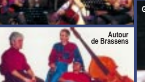
Autour de Brassens