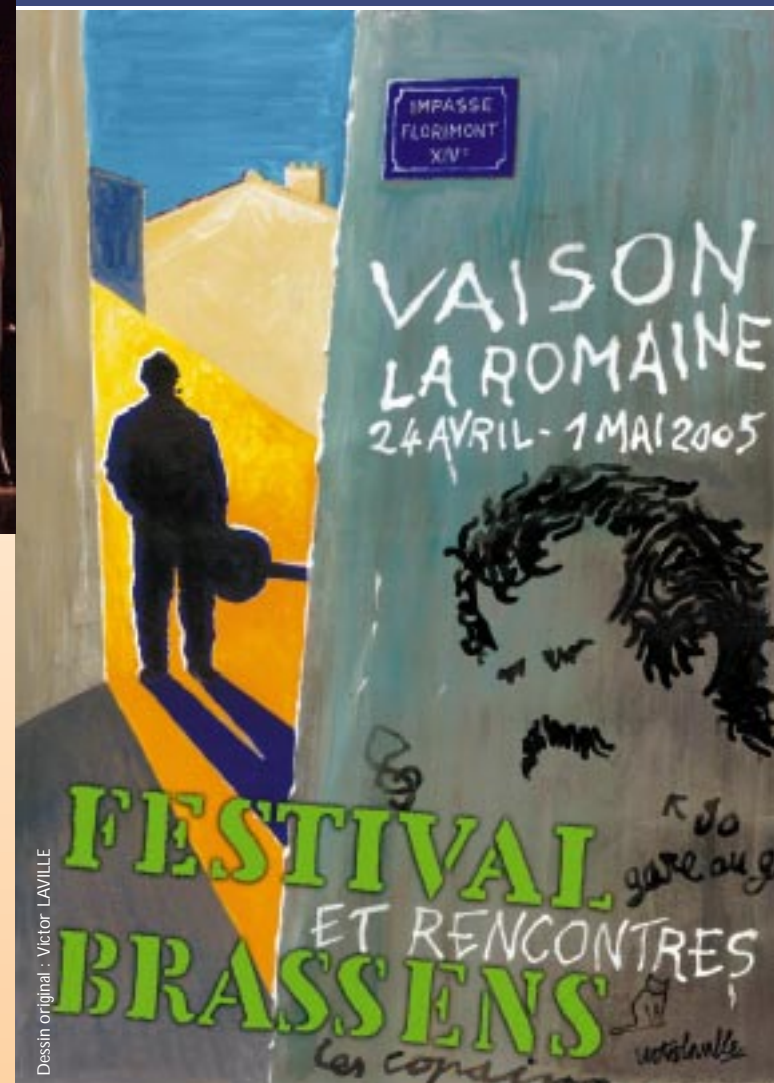
Dessin original : Victor LAVILLE

L'association «Les Amis de Georges Brassens» présente :